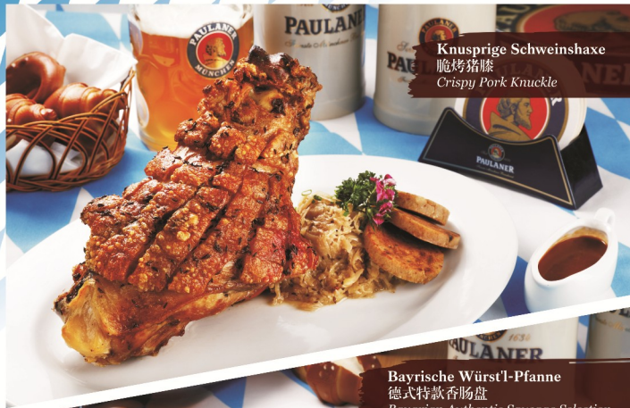
Knusprige Schweinshaxe 脆烤猪膝 Crispy Pork Knuckle