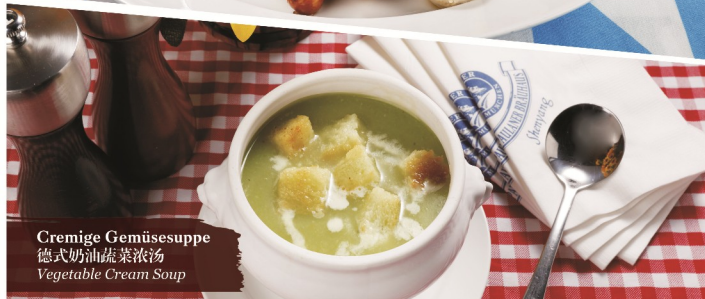
Cremige Gemüsesuppe 德式奶油蔬菜浓汤 Vegetable Cream Soup