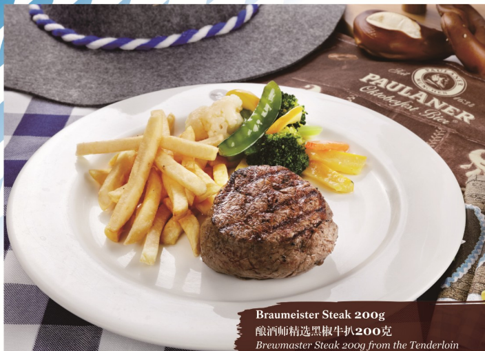
Braumeister Steak 200g