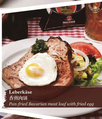
Leberkäse 香煎肉饼 Pan-fried Bavarian meat loaf with fried egg