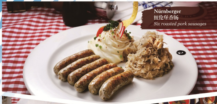
Nürnberger 纽伦堡香肠 Six roasted pork sausages