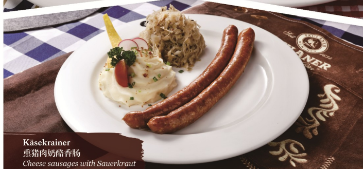
Käsekrainer 熏猪肉奶酪香肠 Cheese sausages with Sauerkraut