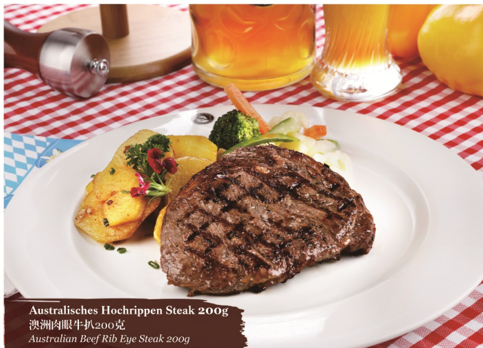
Australisches Hochrippen Steak 200g

Braumeister Steak 200g from the Tenderloin