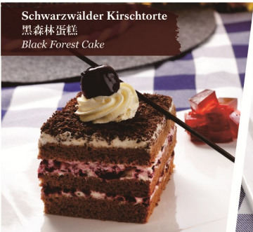
Schwarzwälder Kirschtorte 黑森林蛋糕 Black Forest Cake