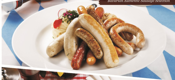
Bayrische Wurstl-Pfanne 德式特款香肠盘 Bavarian Authentic Sausage Selection