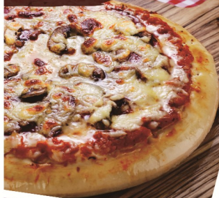
Pepperoni Pizza 意大利香肠披萨 Pepperoni Pizza