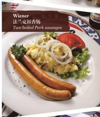
Wiener 法兰克福香肠 Two boiled Pork sausages