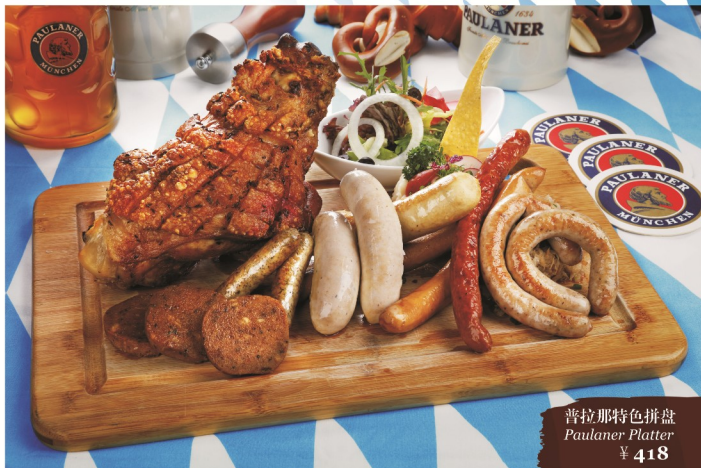
普拉那特色拼盘 Paulaner Platter ¥ 418

脆烤猪膝配德式酸菜及面包丸子 Crispy Pork Knuckle with Sauerkraut and bread dumplings